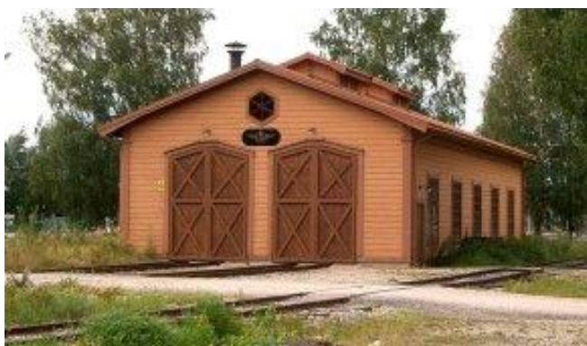
Hamnplan 5, 731 36 Köping