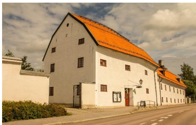
Östra Långgatan 37, 731 85 Köping

Besök gärna vårt museum som bara ligger ett par hundra meter bort.