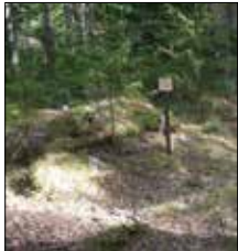
Den plats som idag är utmärkt som Snurran. Foto 2017: författarna.