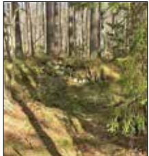
Den plats som idag är utmärkt som Hultastugan.